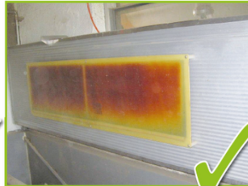
Auch dieses ca. 6 Jahre alte Heizelement ist gleichmässig verfärbt und bleibt weiterhin im Einsatz.

Bei beschädigter Oberfläche können Aussagen wie: „So lange das Heizelement warm wird benutze ich es“ zu Unfällen führen!