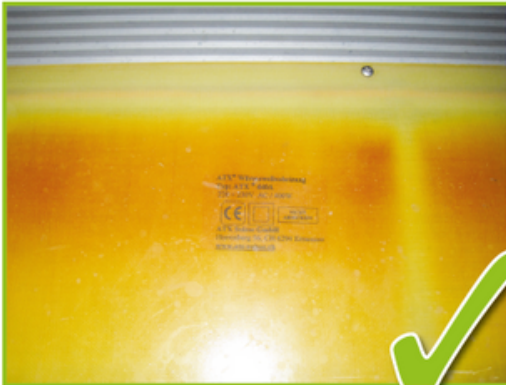
Im Dauergebrauch leicht verfärbtes, intaktes Heizelement.

Beispiele: Normale Verfärbung im Langzeit Gebrauch.