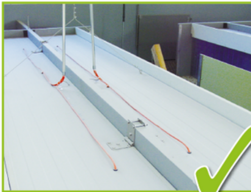
Richtig! Anschlusskabel sind so zu verlegen, dass sie von Schweinen nicht erreicht werden können.

Beachten Sie, dass die Netzanschlussleitung nicht beschädigt ist.