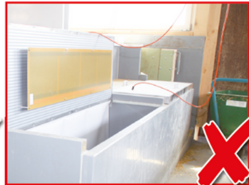
Falsch! Anschlusskabel hängen in den Gang und können beim Einstellen von den Muttertieren beschädigt werden.